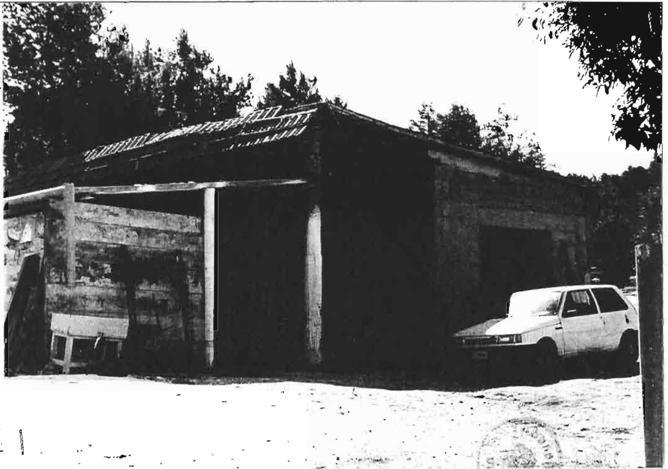
Foto n. 7- Il fabbricato ad uso deposito. Foto n. 8- Piccolo manufatto non costituente volumetria.