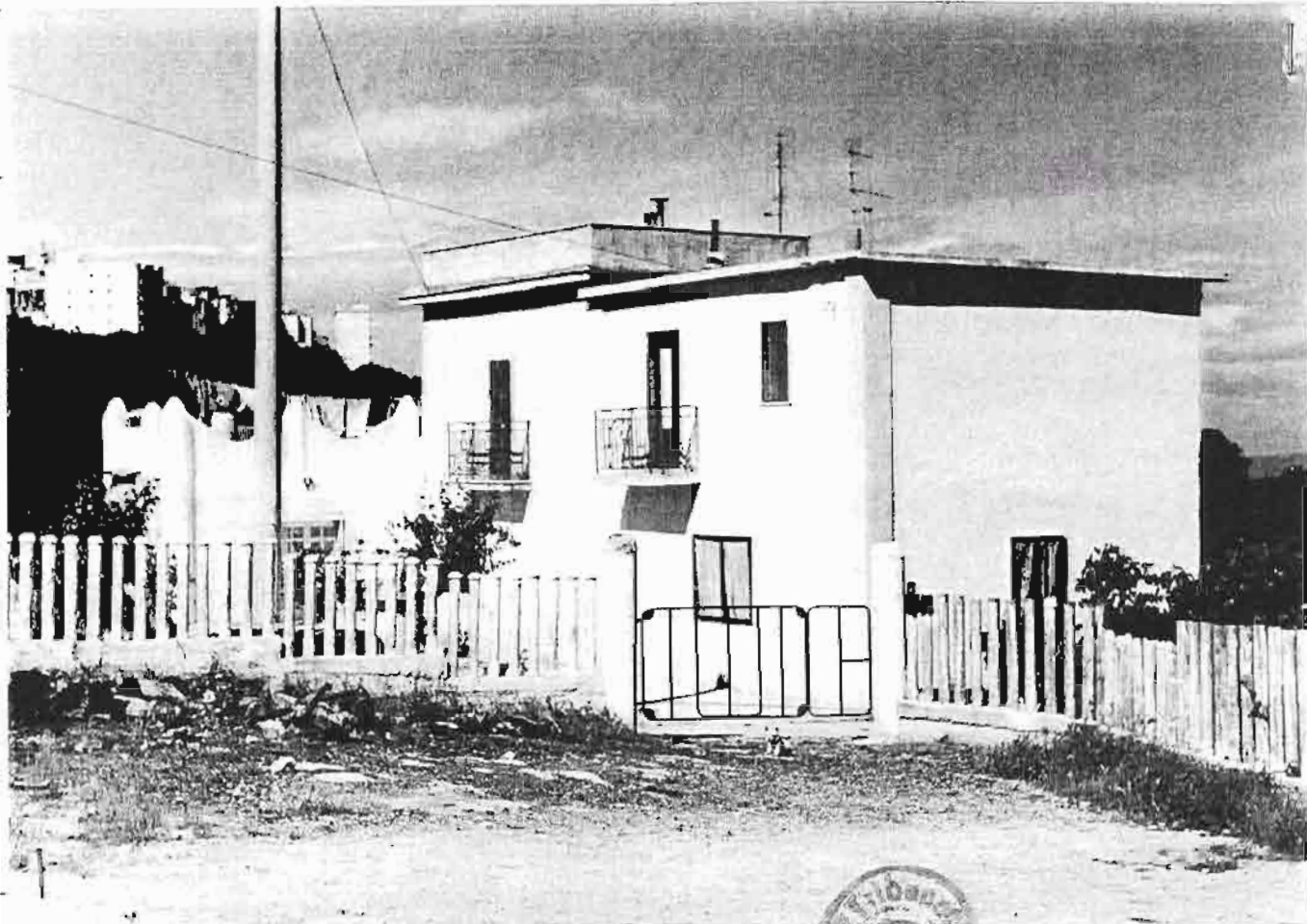
Foto n. 5- Il fabbricato ad uso abitazione. Foto n. 6- Didascalia come alla precedente.