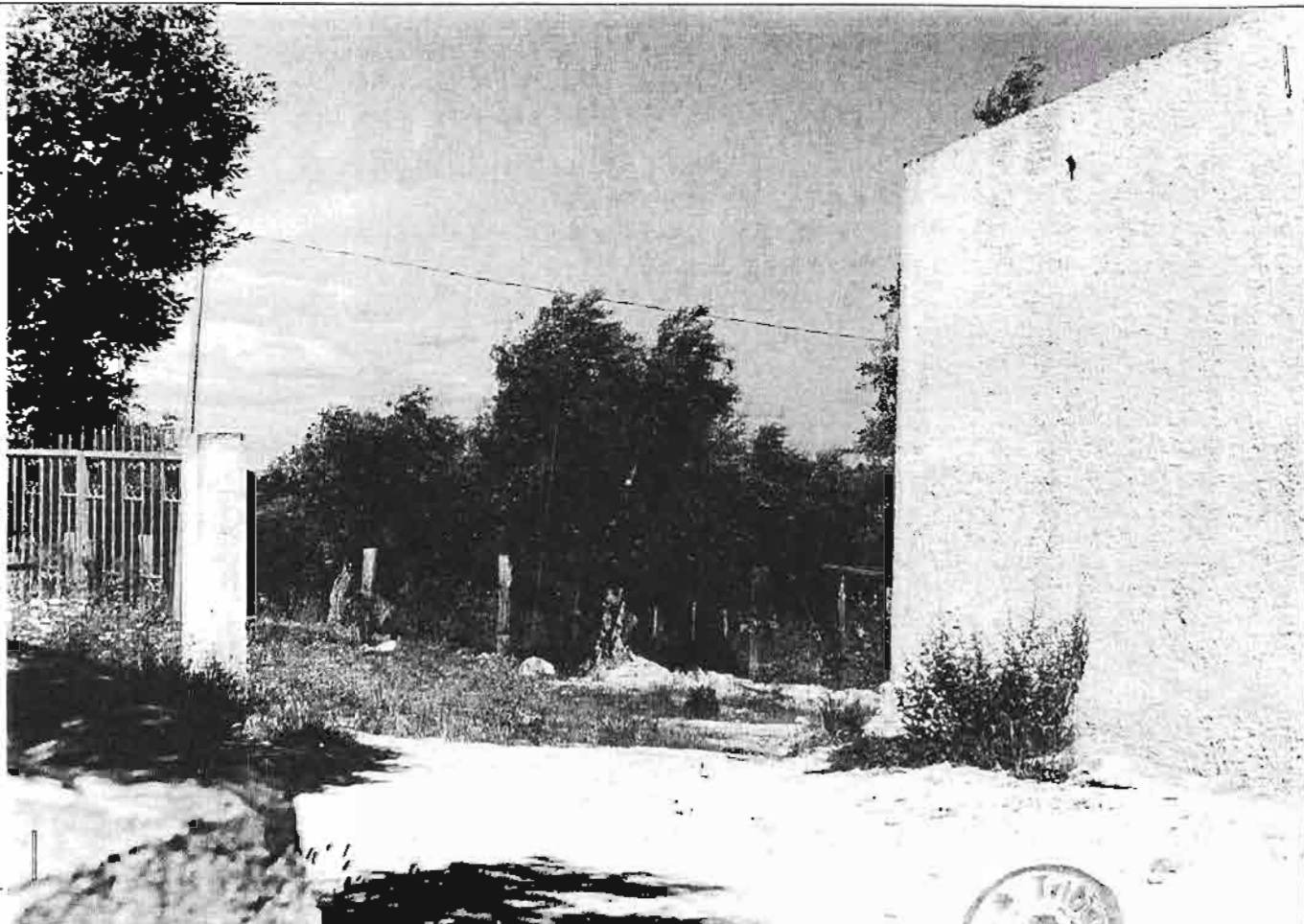
Foto n. 3- Ingresso alla prop. La Saiandra. Foto n. 4- Didascalia come alla precedente.